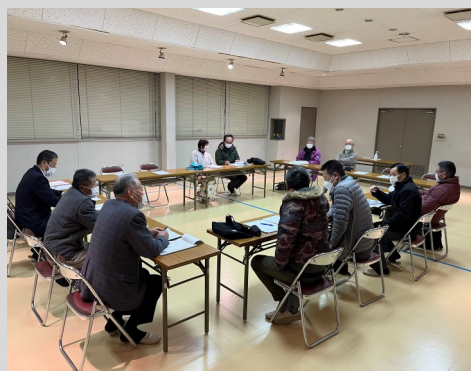
(米来地区社協推進委員会の様子)

各々の協議内容を地区社協会長が中心となり、推進委員と確認し合い、令和5年度の地区社協活動の方向性を決定しました。